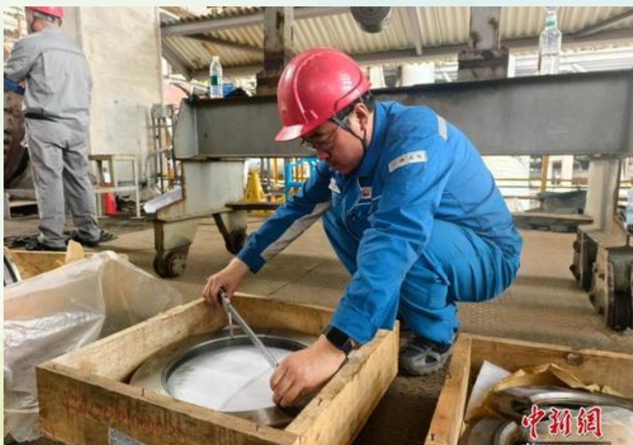
图为广西石化技术人员正在测量设备部件。

当前，机组运行平稳有序、各项参数持续向好，国产化轮盘性能达到并超越国际同类产品标准，为广西石化千万吨炼油、百万吨乙烯高质量发展筑牢装备根基，以科技创新赋能炼化一体化转型升级