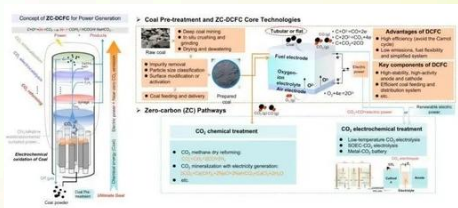
近零碳排放直接煤燃料电池(ZC-DCFC)原理及技术架构。

燃煤发电技术受卡诺效率极限的根本制约，能源转化效率约45%，不考虑碳捕集下，平均碳排放强度超800克二氧化碳/千瓦时，煤炭深度脱碳难以突破。因此，亟需变革传统燃煤发电方式，探索清洁、高效、零碳排放的煤炭发电新技术。